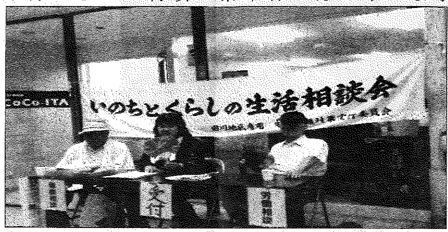
田川ハローワーク前宣伝行動の様子