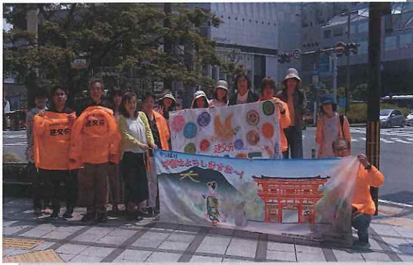
2017/14京都駅前宣伝行動