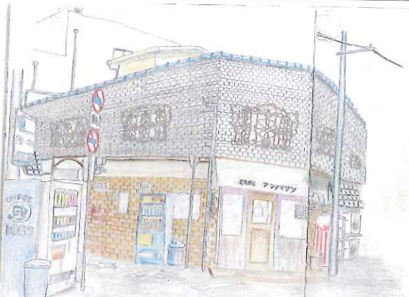
今月は沢画伯（副委員長）のイラスト絵を紹介します。

ここで毎週土曜日・日曜日に激しいチェスの熱戦が繰り広げられています。 予約制の「チェスルームアンパサン」として、チェスの練習会を開いているほかアンパサンチェス研究会の事業所としても活動しています。現在カフェ業務は行っておりません。