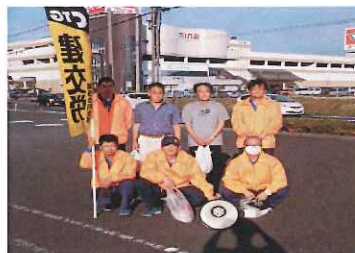
京都北部ブロック