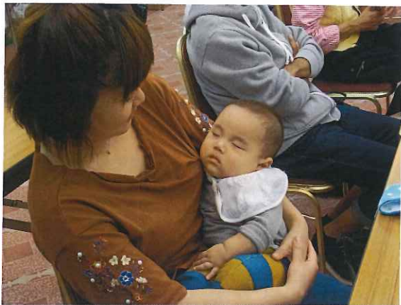
今月は10月1日に開かれた支部定期大会でのひとコマ。