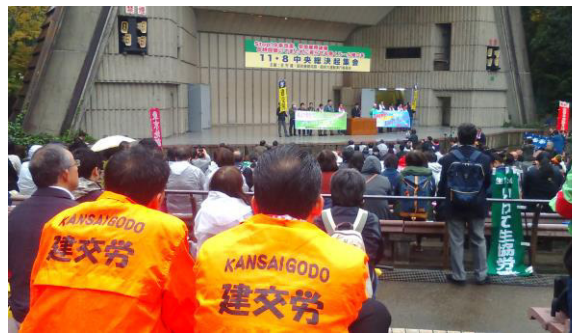
日比谷野外音楽堂での総決起集会

NO.497 全日本建設交運一般労働組合秋田県本部機関紙 2017年12月5日発行 〒010-0976 秋田市八橋南1-2-29 TEL018-823-7748 fax018-823-7751 Email: kenkourouakita@bz03.plala.or.jp