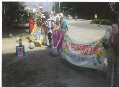
原爆の火を前にて出発式

6月9日(土)、尾張分会より「あいち平和行進」へ2名参加しました。小牧市役所を出発し、