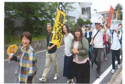
少し年齢層が高めの参加者でしたが、みなさんとてもお元気！

向日市役所から長岡京市役所まで約1時間、途中で大雨にまわれながらの行進でしたが、わいわいと元気に歩きました。このコースは20年ぶりで懐かしかったです。(鶴田)