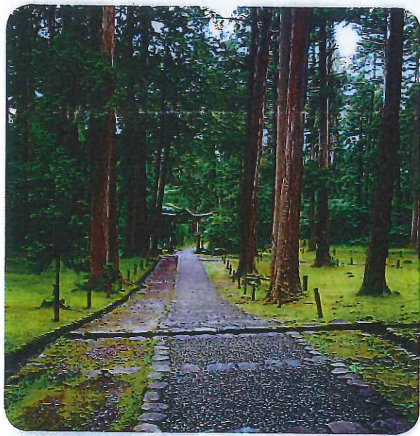
福井県、白山平泉寺 暑い日にホッと一息

法や面接時の受け答え、就労場所への交通機関利用等も含まれます。今回の法改正では無料食堂の運営、子どもへの無料学習支援、無料宿泊所、障害者支援も対象とされ、社会福祉法人が全面にたち社会福祉士の有資格者が求められています。事業団では、二トの皆さんに対して王子で行っているような障害児支援活動に伴う経歴談をこうして若者に伝えて欲しいと依頼されています。