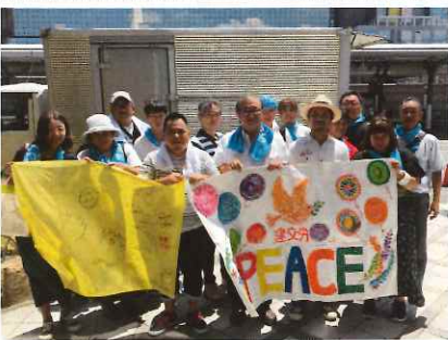
京都駅前支部より11名参加