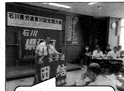
県労連大会で発言する中本書記次長