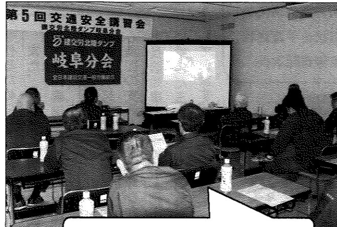
岐阜分会が開いた交通安全講習会

高岡分会は昨年6月、金沢分会今年1月と、29年度は開催することができましたが、今年度はまだ