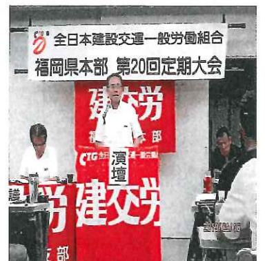
福岡県本部緒方書記長

方針では、職場の要求実現と第4次中期計画に基づく組織拡大目標の達成に向けて、1、春闘アンケートの取組みで総対話を行う、2、業種別運動を旺盛に取り組み、3、建交