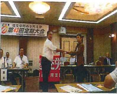
表彰を受ける大阪分会

春と秋に烏丸駅周辺でオフィス街のお昼時を狙って宣伝行動を実施し、各300枚ビラ配布を行いました。また3月と7月に交流会を実施しました。9月16日に京都府本部