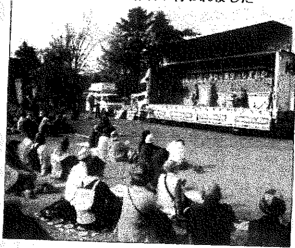
各団体から報告が行われました