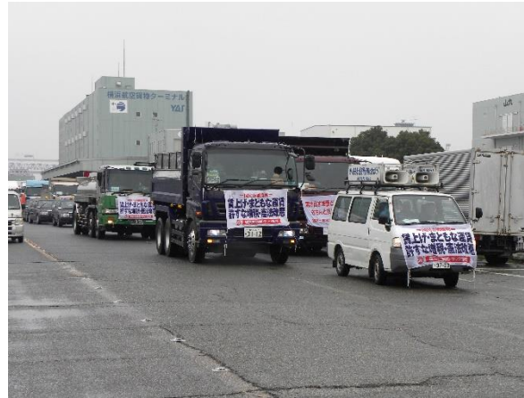
交運共闘の仲間と共に45台が参加して車両パレードを実施しました。(横浜市)

3月3日(日)に神奈川交運共闘が主催する自動車パレードに建交労、自交総連、横浜港湾労組、検数労連、全国税など80人の仲間とタンクローリー、ダンプ、海コンヘッド、タクシー、乗用車、宣伝カーなど45台の車両が午前10時に横浜の山下埠頭に集結しました。当日は冷たい雨が降り続きましたが、昨年の自動車パレード参加者「60人・車両40台」を上まわり、交運共闘に結集する各組織の今春闘に向けた意気込みを感じさせるものでした。建交労神奈川県本部からも18人の仲間とダンプカー5台、タンクローリー1台、乗用車2台が結集し山下ふ頭を出発するパレードの隊列でパレードの成功に貢献しました。