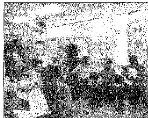
血圧はどうかかな?