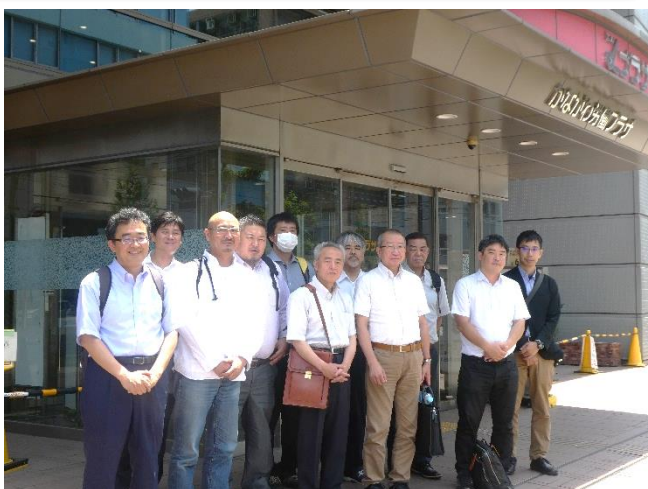
県労委の要請行動を終えた労働プラザ前の参加者

県労委は具体的な回答を避けましたが労働側の県労委に対する問題意識を伝えることはできました。その意味でもこうした行動の必要性が明らかとなりました。