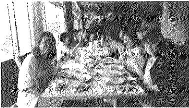
↑手前の3人が千代田橋の参加のみなさん