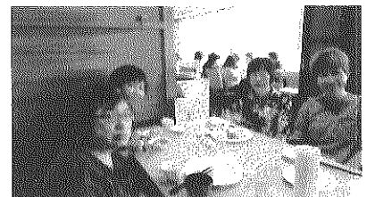
普段できない話もできて満足。丸池のみなさん。