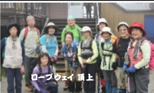
ロープウェイ 頂上