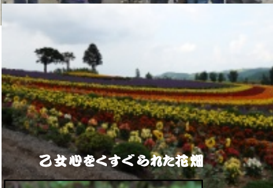
乙女心をくすぐられた花畑