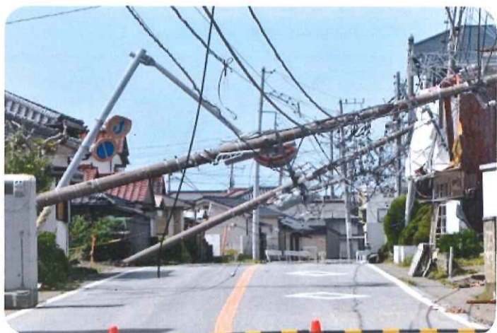
強風で倒れた電柱(館山市)