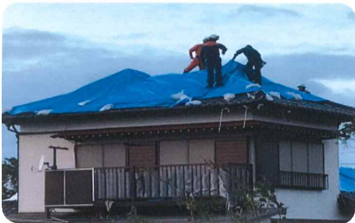
人手の足りないブルーシート作業(南房総市)

9月5日に発生した台風15号によって、千葉県ではいまだ多くの被災者が厳しい生活を余儀なくされています。進路が少し西にずれていれば、本県も大きな被害を受けていたのは間違いないありません。人ごとではありません。