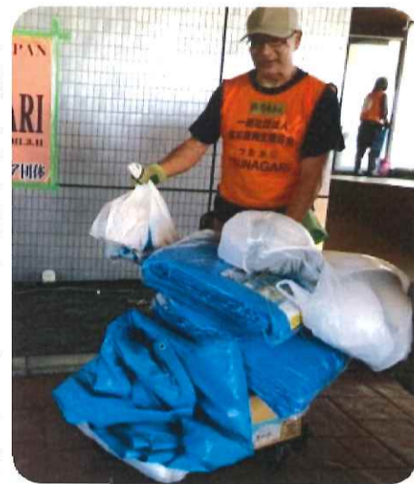
9月15日館山市のボランティアセンターにブルーシート、土嚢等を緊急支援。

9月5日に発生した台風15号によって、千葉県ではいまだ多くの被災者が厳しい生活を余儀なくされています。進路が少し西にずれていれば、本県も大きな被害を受けていたのは間違いないありません。人ごとではありません。