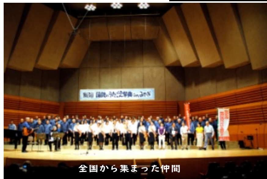
全国から集まった仲間

送の安全・安心を支える労働条件・労働環境を確立し、実行ある規制強化に向けて職場と地域から共同をつくりだしていくことが重要であると考えています。国鉄のうたごえの皆さんの「歌声」に