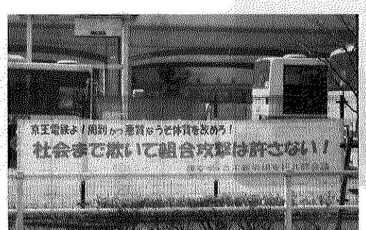
19春闘 3.14ストライキ決起集会にて

転において時間を守り安全・安心に乗客を運ぶ事以外、会社は何を評価しようと言うのか。残業に依るほど評価が上がり16時間もの長時間運転をする運転手が発生している今の評価制度は間違っている。連合労組は春闘における要求提出すら行わない。定年後、ひたすら低賃金でバス車両の清掃業務に従事させられてきた差別に対しても、引き続きたたかいます。