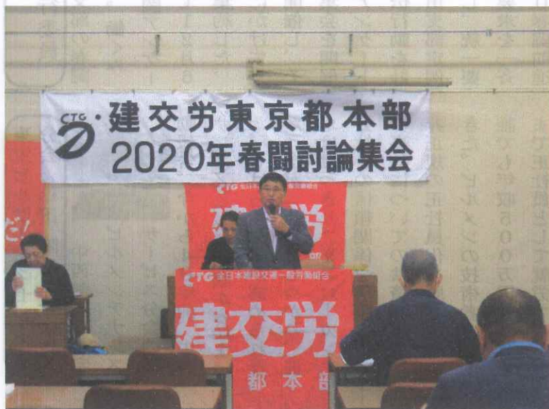
記念講演 岩橋 祐治 全労連副議長