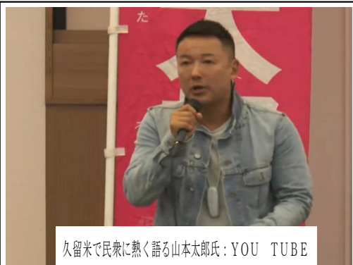
久留米で民衆に熱く語る山本太郎氏：YOU TUBE

(後述・れいわ)は、今年4月に旗揚げし、主たる目標、消費税廃止を含め8つの政策を掲げています。