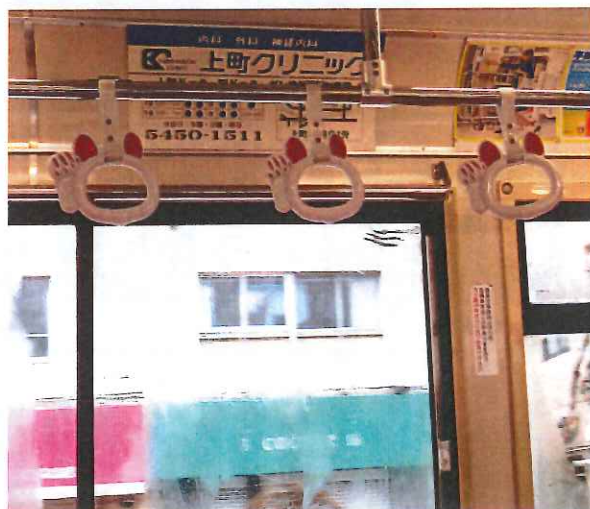
内装も趣向をこらしています

いるのだそう。世田谷線50周年を記念したもので、招き猫の名所・豪徳寺にちなんでのデザインです。路面電車のほのぼのした風景に猫電車が加わって、一層魅力的な街並みになりますね。