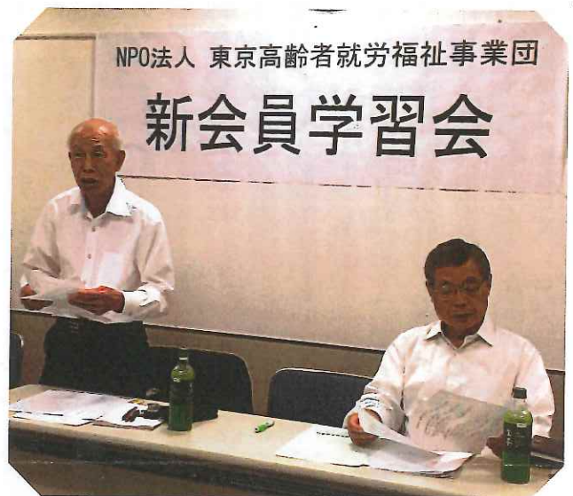
安藤理事長からのあいさつ