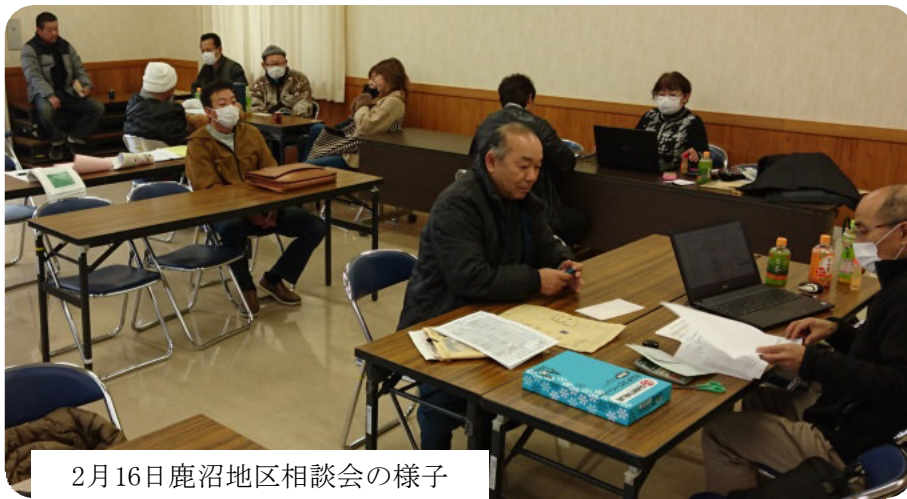
2月16日鹿沼地区相談会の様子

二月から三月十六日に申し出てください。まで確定申告相談会を実施しています。 【用意するもの】 ① 昨年の売上げ、経費がわかるもの。自主計算書のない人は事務所 ② 扶養家族の氏名、生年月日 ③ 昨年支払った国民健康保険、介護保険の金額 ④ 医療費の領収書。同じ世帯なら家族全員の分を合算できます。 ⑤ 妻、子供の収入金額 ⑥ 国民年金、生命保険、地震保険などの控除証明書 ⑦ 税務署から送られてきた申告書、納付書、印鑑（シヤチハタ不可）、前年申告書控 ⑧ 住宅を購入又は増改築した人は組合に問合せを。