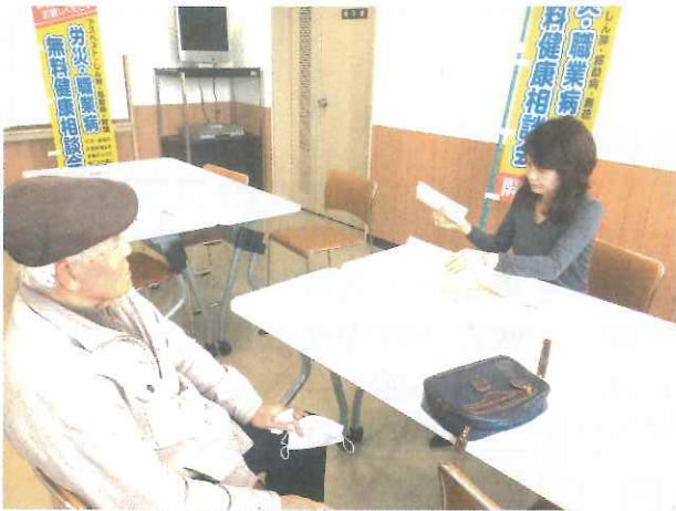
笠原で開催された健康相談会の様子

組合では潜在した被災者の救済のために、相談会を開催しています。新聞折り込みチラシで開催を周知すると同時に、東濃分会の組合員のみなさんが積極的に参加を呼び掛けてくれました。当日は、4名が来所されました。そのうちの2名は組合員のみなさんがさそってくれたと喜んでみえました。来所された