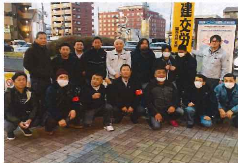
大阪分会・南大阪ブロック

は17時30分に集合して全国トラック部会と酸素部会の統一ピラ及び堺労連の労働相談ホットラインピラをそれぞれティッシュに折り込んで750枚巻きましました。参加は、大陽液送5名、寿運送5名、大田貨物運送5名と関西合同支部橋本副委員長と関西支部の島向氏の計17名でした。