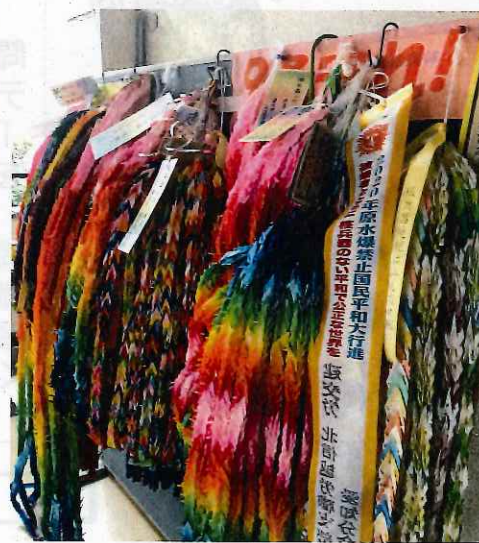
広島県本部に全国から届いた千羽鶴。青年部ニュースより

クト合計で三四〇〇羽以上の鶴が届いたそうです。8月4日に、広島にて国民平和行進が開催され、鶴の半数は、平和行進のゴール地。