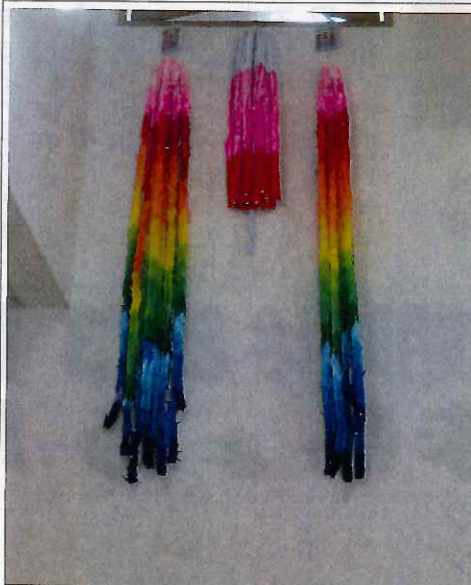
皆さんと一緒に作り上げた鶴には「核兵器廃絶」を掲げました

今年、新型コロナウイルスの流行で、反核トラックキャラバンの例年通りの行動がなくなり、建交労全国青年部が全国の仲間へ呼びかけている反核キャンペーンの「折り鶴プロジェクト」に参加しました。平和への願いをこめ、折り紙で鶴を折り、広島平和公園へ届けるプロジェクトです。