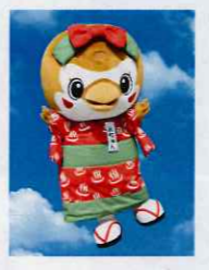
通常時のおちゅん

今月の一枚は、中央定期大会にて、旅館のゆるキャラ「おちゅん」の物語「舌切り雀」の物語が生まれたお宿、ホテル機部ガーデンの公式キャラクターです。「おちゅん」もしっかりマスクをし対策をとっています。 組合員の皆様の一枚をお待ちしております。支部までメールでお寄せ下さい。(アドレスは1枚目に)