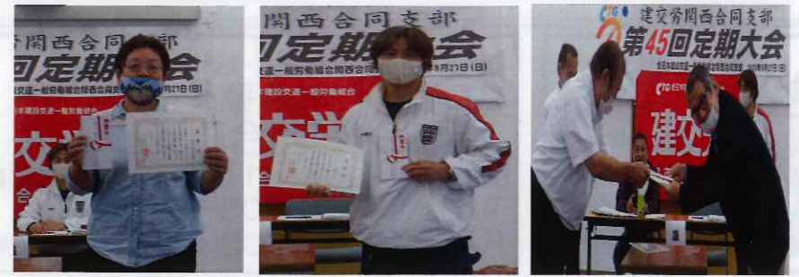
支部女性部 丹後分会 大阪ブロック

今年の表彰は、「コロナ禍においても建交労の組織拡大に向けた宣伝活動」に奮闘され、運動の先駆的役割を發揮されたとして、「大阪ブロック」・「丹後分会」が、「建交労折鶴プロジェクト」に大きな力を發揮した「支部女性部」が受賞しました。