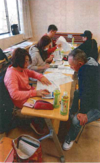
2020年 加南分会・計算会の様子

緊急事態宣言 2021年を迎え、今年も確定申告の時期がやってきました。今年も例年の計算会と違い、新型コロナウイルス感染症緊急事態宣言が首都圏をはじめ各県で発令されている中で、スタートとなりました。