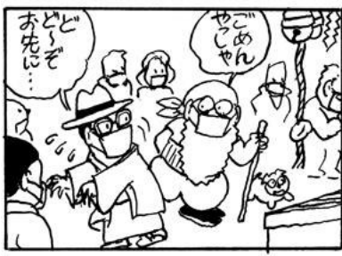
カマヤん 初もうで ありむら潜