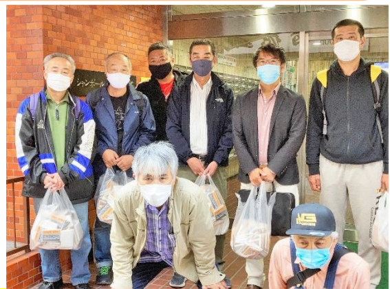
ポストに貼る前の事務所のビル前で撮影

午前10時に支部事務所に集合した執行委員は各自が100枚(合計900枚の「建交労全国トラック部会ビラ」下の写真)をポケットティッシュに差し込んでから行動に出発です。