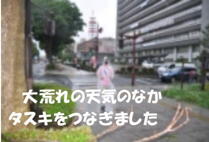
大荒れの天気の中 タスキをつなぎました