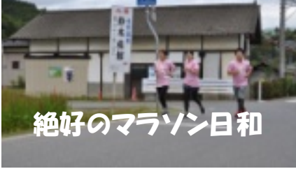
絶好のマラソン日和