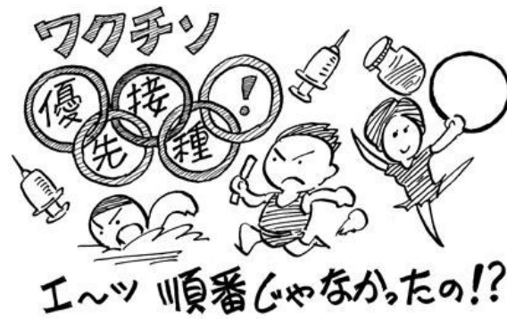
五輪のため犠牲を払わねば...