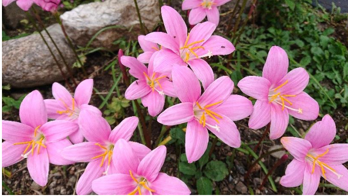
ゼフィランサス (別名・レインリリー)

とても丈夫な球根で、花壇に植えても、鉢やプランターでも良く花が咲きます。また植えっぱなしにできるので手間がかかりません。同じ仲間には白花のタマスダレ・黄色のシトリナがあります。