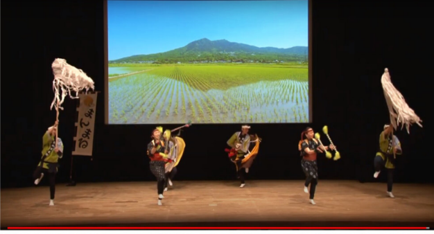
第29回パート・派遣など非正規ではたらくなかまの全国交流集会