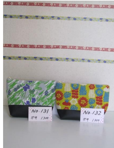
ポ中 131 ポ中 132