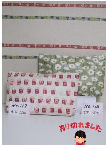
ポ大 117 ポ大 118