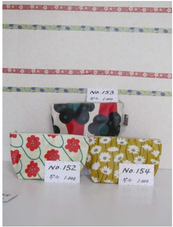
ポ小 152 ポ小 153 ポ小 154