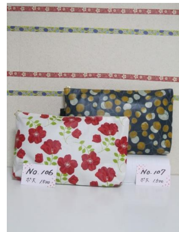
ポ大 106 ポ大 107