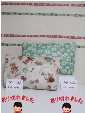
ポ大 121 ポ大 122