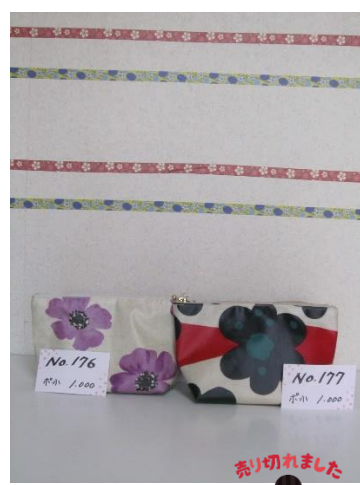
ポ小 176 ポ小 177