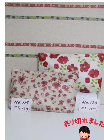
ポ大 119 ポ大 120