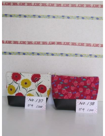
ポ中 137 ポ中 138