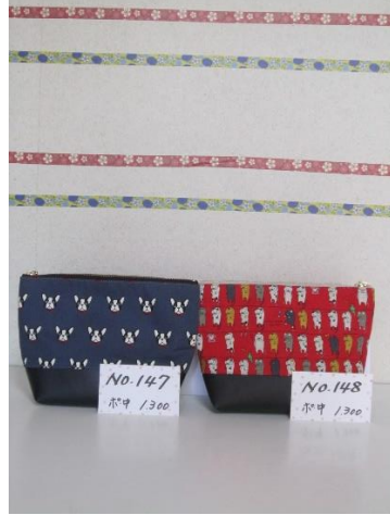
ポ中 147 ポ中 148