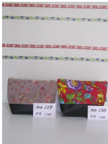
ポ中 129 ポ中 130