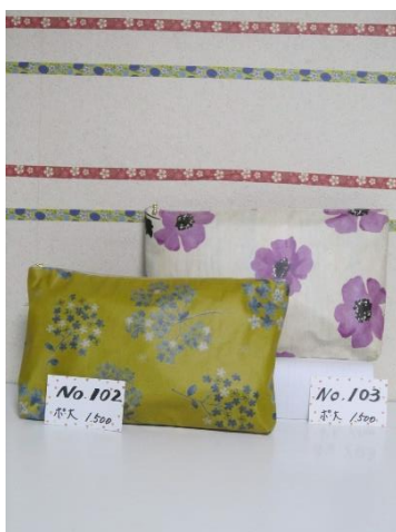
ポ大 102 ポ大 103