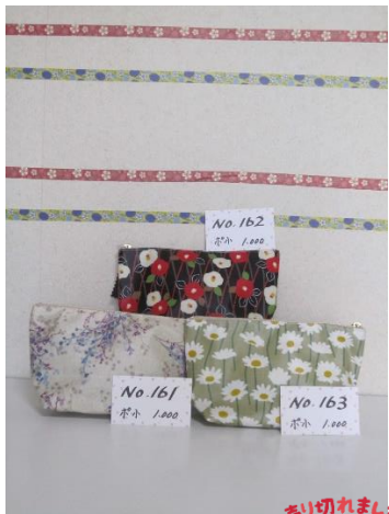
ポ小 161 ポ小 162 ポ小 163