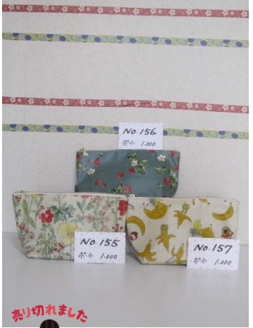
ポ小 155 ポ小 156 ポ小 157