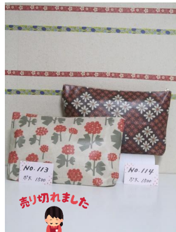
ポ大 113 ポ大 114