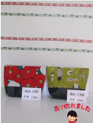
ポ中 135 ポ中 136