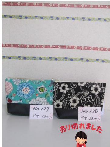
ポ中 127 ポ中 128