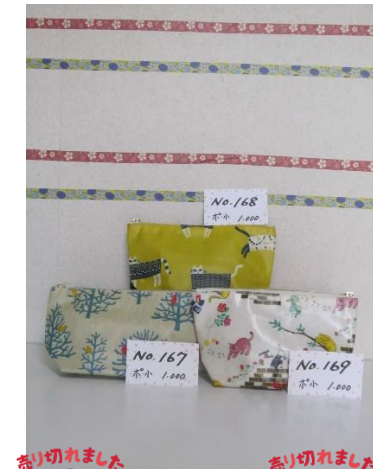
ポ小 167 ポ小 168 ポ小 169