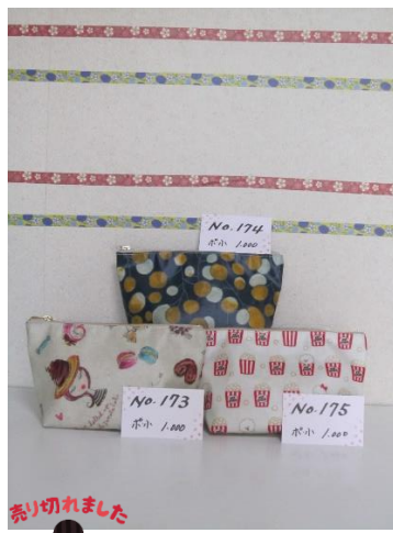
ポ小 173 ポ小 174 ポ小 175