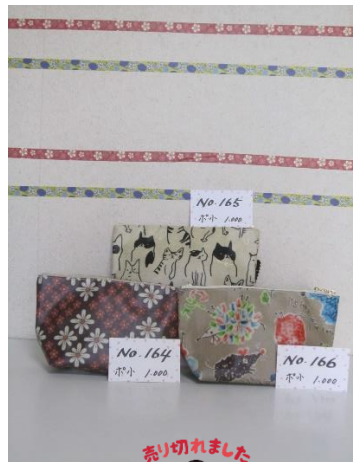
ポ小 164 ポ小 165 ポ小 166