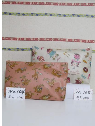
ポ大 104 ポ大 105