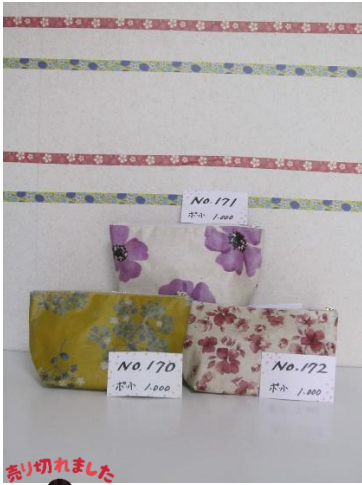
ポ小 170 ポ小 171 ポ小 172