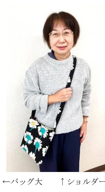
←バッグ大 ↑ショルダー