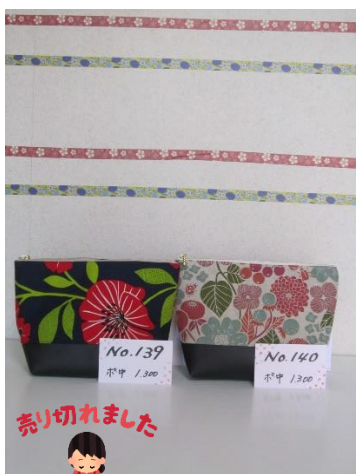
ポ中 139 ポ中 140