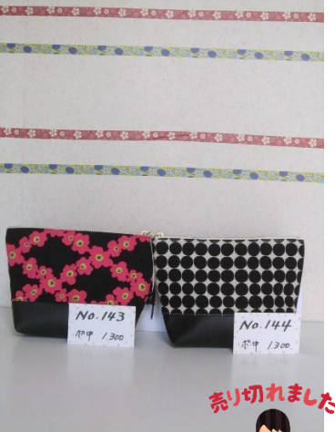
ポ中 143 ポ中 144