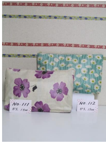
ポ大 111 ポ大 112