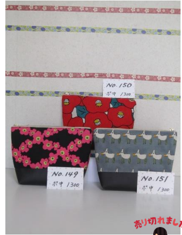
ポ中 149 ポ中 150 ポ中 151