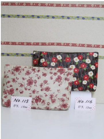
ポ大 115 ポ大 116