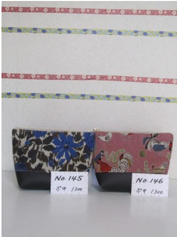
ポ中 145 ポ中 146