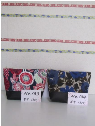
ポ中 133 ポ中 134