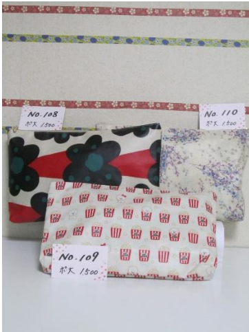
ポ大 108 ポ大 109 ポ大 110