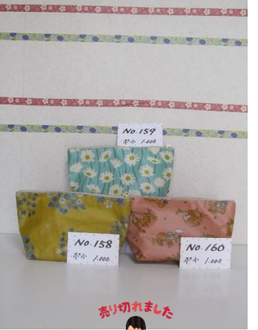
ポ小 158 ポ小 159 ポ小 160