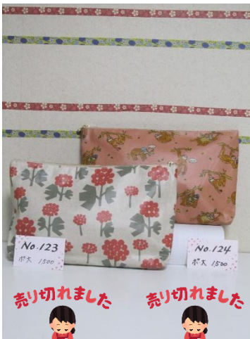
ポ大 123 ポ大 124