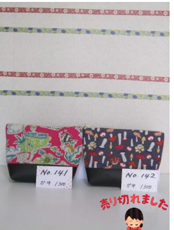
ポ中 141 ポ中 142