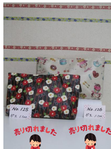
ポ大 125 ポ大 126