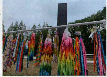
上 広島 下 長崎 それぞれに献納されました。 建交労 青年部ニュースより