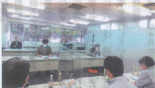
建交労建設6部会 大手ゼネコ交渉