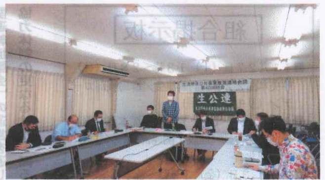
国土交通労働組合の王子会館でリモート併用で開催されました

生活関連公共事業推進連絡会議(略称：生公連)は10月23日(土)、オンライン併用で第40回総会を開催しました。生公連は、建交労、国交労組、建設関連労連、都市労、水資労など官民共同の組織です。防災など国民の暮らしに直結した公共事業を推進し、公共施設の維持・修繕予算を大幅に増額することや、公共工事、業務委託などにおけるダンピング受注を防止し、地域建設業の経営の安定と建設分野で働く全て