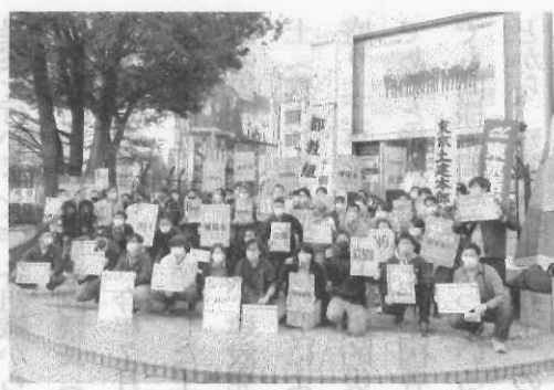
新宿駅東口で開催されました