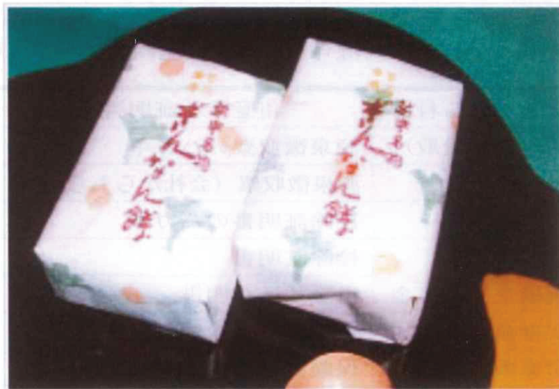
【北陸ダンプ組合員数】

富山の氷見市のお菓子屋さんおがやの“ぎんなん餅”。銀杏の美しい翡翠色を生かした小ぶりで上品な餅菓子です。口に入れると歯ざわりがやさしく、ほのかな甘みと銀杏の香りがふわあーっと広がってきます。これ大好きです。この前、富山へ行った折に偶然にお店を見つけたんだけど残念ながらお休みでした。久しく食べていない！う〜ん、食べたい！