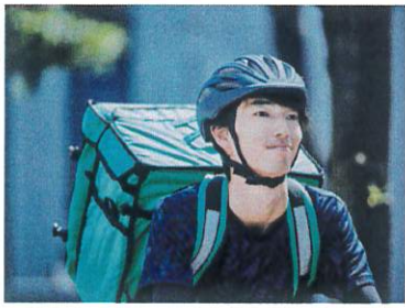
ウーバーイーツの配達員 雇用関係のないもと厳しい労働を強いられています。

インボイスには、取引金額、年月日、品目、消費税額などのほか税務署が割り振った登録番号が記載されます。事業者からは「そもそも制度がよく分からない」「複雑で事務負担に対応できない」などの不安の声