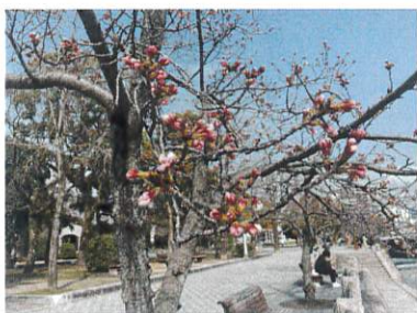
広島の開花宣言は3月21日春分の日。写真は、平和公園の桜でまだほとんどが「つぼみ」の状態(3月24日)

※県本部の「クスノキ通信」は毎月一回発行しています。各支部や職場でのホットな話題や取り組みなど、身近な話題を、ファクスや、「メール」でお寄せください。メールとファクスは以下の通りです。