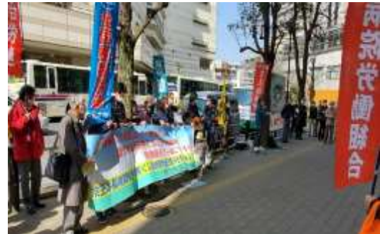
東京・京王電鉄本社前(3月10日)

また、鉄道本部東日本はJR貨物本社前で、同じく西日本では本社前での宣伝行動を実施しました。各とりくみには、全労連や県労連、支援共闘会議などの仲間たちが