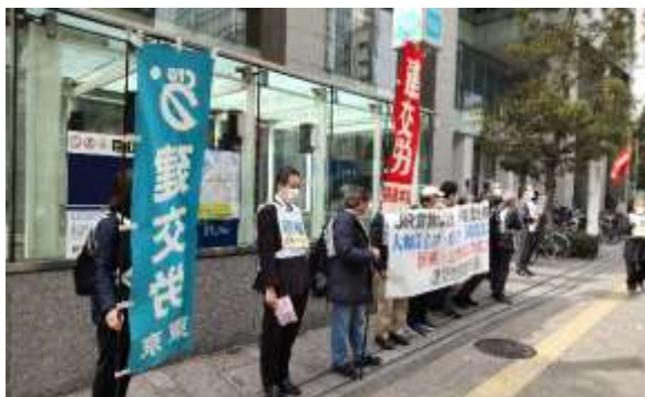
東京・JR貨物本社前(3月10日)

組の仲間たちは、従前から続いている賃金差別などの不当労働行為を一刻も早く解決し、内部留保金を活用した賃上げの実施を訴えました。