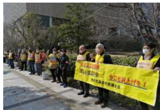
大阪・JR西日本本社前(3月10日)

京王新労組の仲間たちは、22春闘では37,500円の賃上げ要求を掲げ、長時間勤務や残業競争に拍車をかける評価制度の改善を求めています。しかし、会社はコロナ禍での減収を理由に一時金カットを強行しています。京王新労