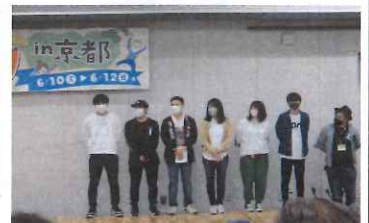
関西合同支部のみんなで集合写真