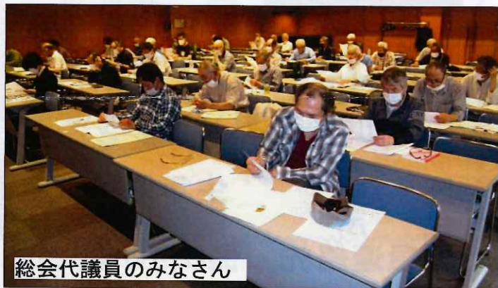
総会代議員のみなさん

最近になって新型コロナウイルス「B.A.5」により、連日過去最高の感染者となり全国で一日に20万人を突破し、医療体制が逼迫し、自宅療養者10万人を超えて、医療体制が危機的な状態になっています。今やるべきは感染防止と医療体制の万全の体制をとるべきです。