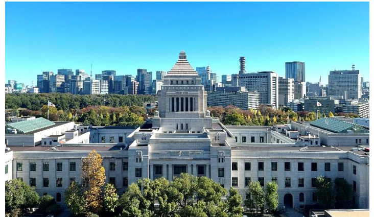
議員会館から撮影した国会議事堂

新たな賛同署名を取り組むために、事前学習会を行い、約40人を8班に編成し160名を越す衆参国会議員への要請がスタートしました。(闘争本部トンネル新賛同署名・号外より)