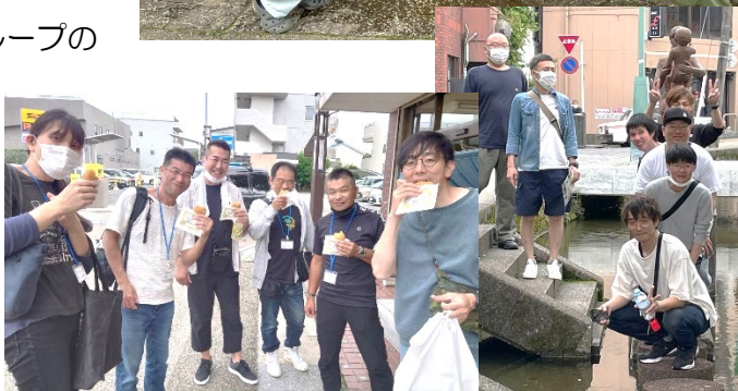
▲各グループ、地図を片手に三島巡り。みんないい表情！