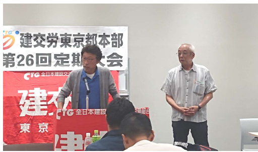
バス関連支部(京王新労組)の仲間