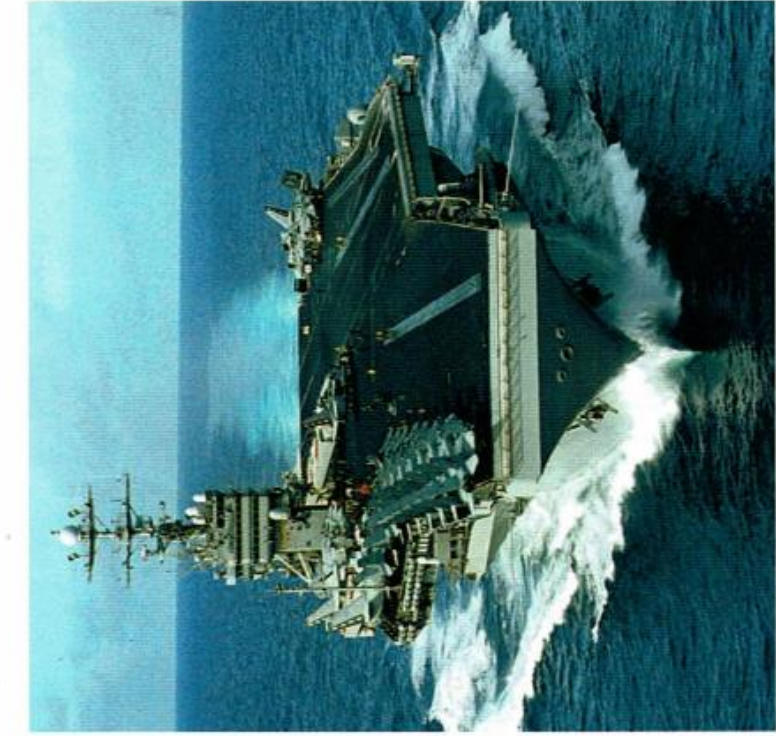
【原子炉2基を積む空母＝東京湾に浮かぶ原発】

在日米海軍横須賀基地は1973年10月に米空母ミッドウェーの「母港」とされ、2008年に原子力空母ジョージ・ワシントンの配備。2015年10月1日、原子力空母ロナルド・レーガンの交代配備。横須賀はベトナム戦争など米国の侵略と干渉の出撃拠点とされてきました。今年で50年、半世紀となります。さらに、来年24年後半には、現在の空母レーガンに代わって、新たに装備を強化した最新鋭艦となった空母ジョージ・ワシントンと再び横須賀に配備しようとしています。米国は横須賀を遠い将来まで母港とし、永久母港化を狙っています。これに日本政府は追従しています。米本国外で米空母の母港としているのは、世界中で日本だけであり、横須賀だけです。