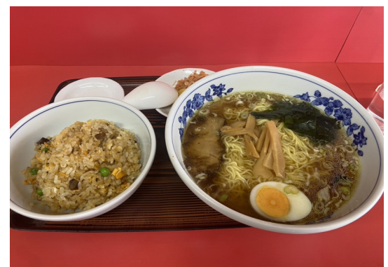
ラーメン・チャーハンセット680円。大丈夫か?

今回は香龍さんに来ました。早めのお昼、初めて入るには少し勇気がある雰囲気を感じながらお店を覗くとすでに大勢のお客さん!。ラーメン・チャーハンセットとシューマイを注文。これぞ老舗の町中華、どこか懐かしさを感じる味。何よりこれだけ食べて1030円! 安い! (by研修生A)