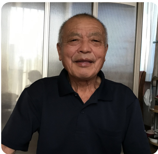
4年前にダンブは引退。組合には継続加入。