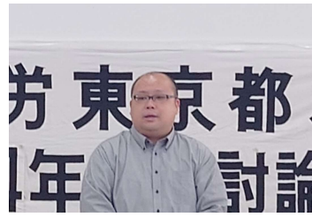
座長 石塚副委員長