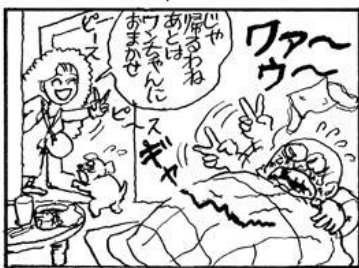
実話をカマヤンバージョンで