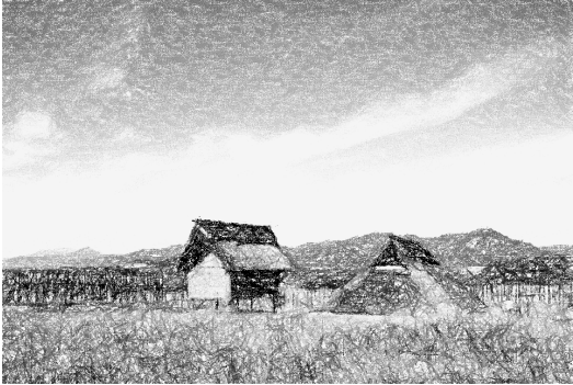
佐賀県吉野ヶ里遺跡