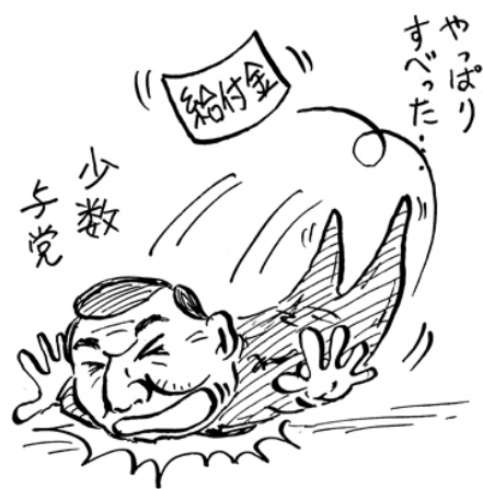
それより消費税減税!