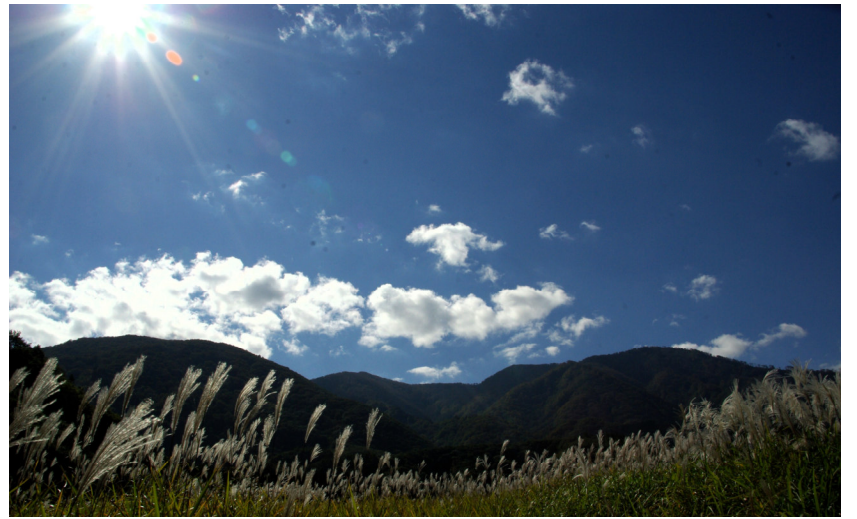
宮城県大崎市鳴子温泉鬼首(おにこうべ)