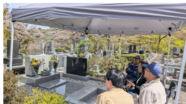
高尾霊園までは高尾駅からタクシーで5分 建交労東京共同墓所の会 TEL:03-3820-8644

墓参の後、高尾駅前では参列者みなでお食事をしました。高尾霊園は、管理事務所に隣接する会場で法事やお斎（おとき）も執り行うことが出来ます。また、高尾霊園の他に、私たちは足立区易行院に共同墓所を管理しており、こちらのお墓は全日自労足立分会が建立し、2021年に東部支部足立分会の仲間が墓石を改修されました。いずれのお墓も、組合員とご家族は、どなたでも利用することが出来ます。（詳しくは建交労東京都本部共同墓所の会までお問合せください。）