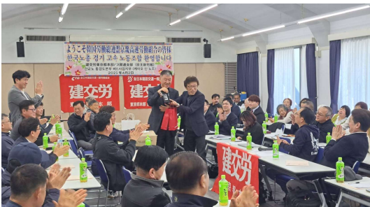
両組織の友好を記念して記念品交換