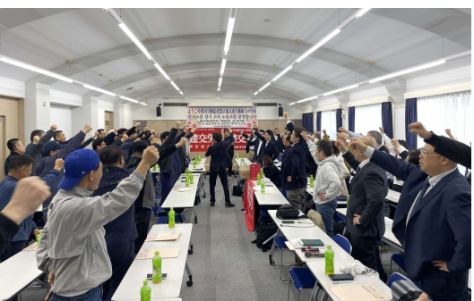
お互いに「団結がんばろう！」でエールの交換