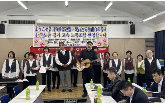
犬熊さんと、いろそら！合唱団