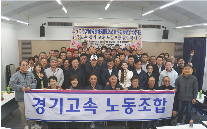
横断幕:「京畿高速労働組合」