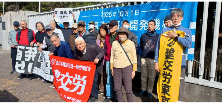
旅館では日頃の疲れを取り、夜は宴会で和やかな交流の場になりました。